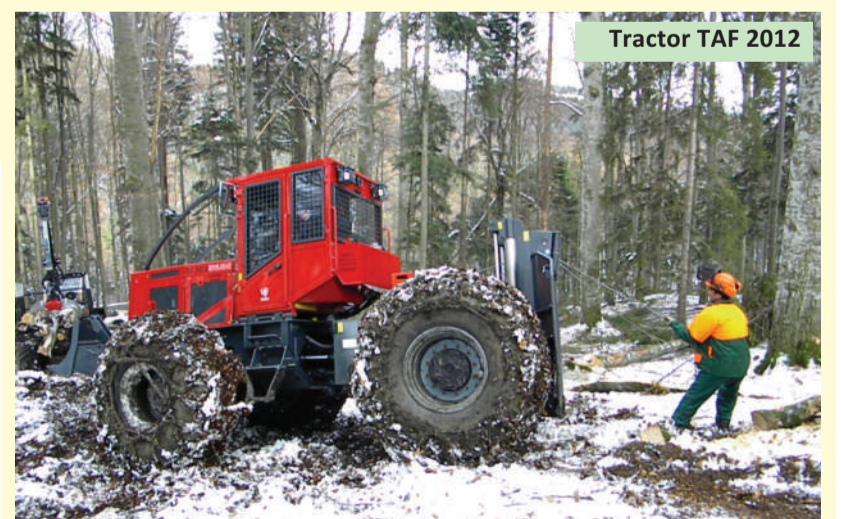
Tractor TAF 2012