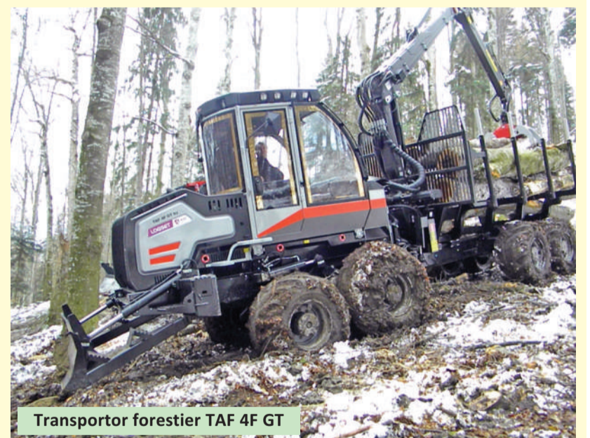
Transportor forestier TAF 4F GT

tiv 150 de persoane reprezentând peste 50 de firme și ocoale silvice din județul Suceava, din județe limitrofe și nu numai. Au participat, de asemenea, colaboratori ai firmei IRUM din Finlanda și Bulgaria. Activitatea în teren a celor două utilaje a fost apreciată de participanții la demonstrație și pare a fi confirmat o caracterizare a producătorului: „Tractoarele noastre sunt practice, robuste și funcționale, fără elemente inutile și extravagante, proiectate să lucreze în orice condiții.”