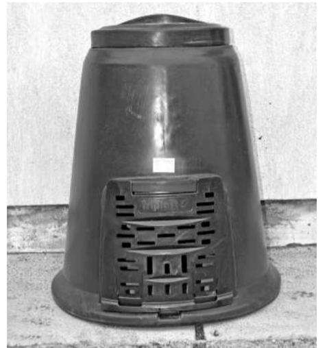
Incinte pentru compostare individuală