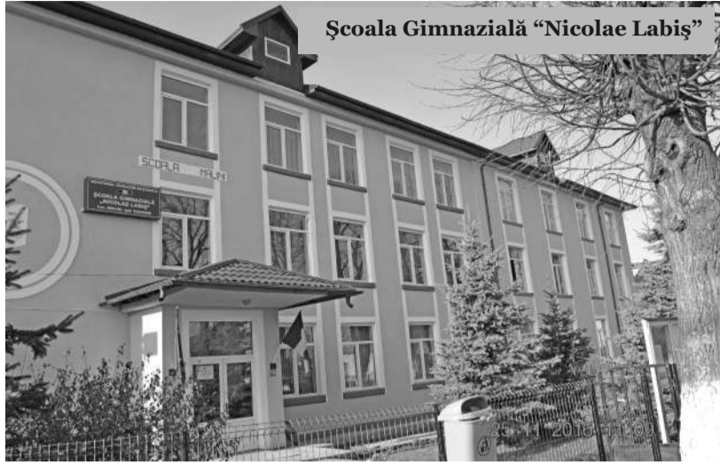
Școala Gimnazială "Nicolae Labiș"