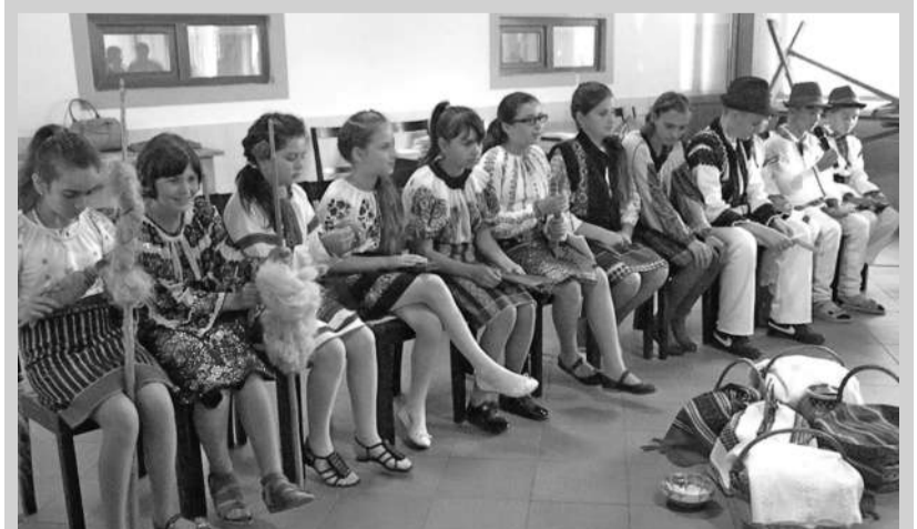
Șezătoare cu elevii de la Școala Gimnazială Suha

Se spune că folosind autoritatea sa de episcop la Mira