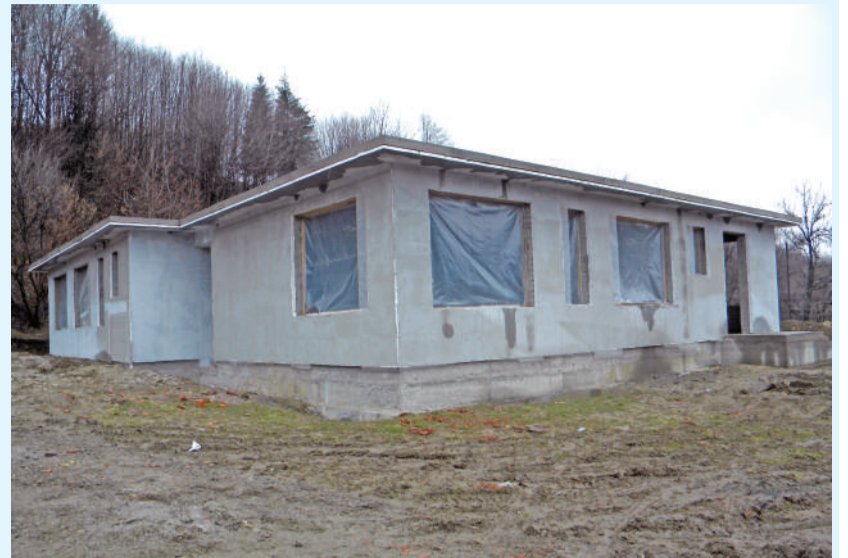
Există speranța ca grădinița de la Poiana Mărului să fie finalizată înaintea începerii anului școlar 2014-2015