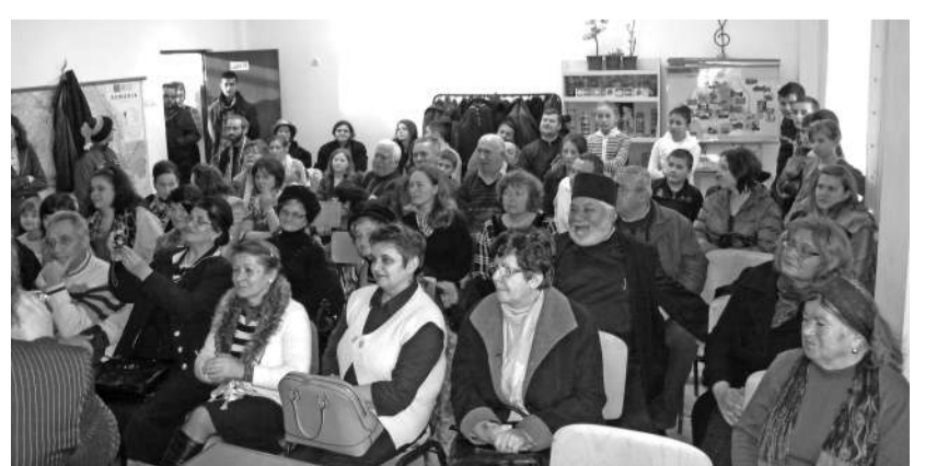
Asistență numeroasă la lansarea volumului „Cromatismele”