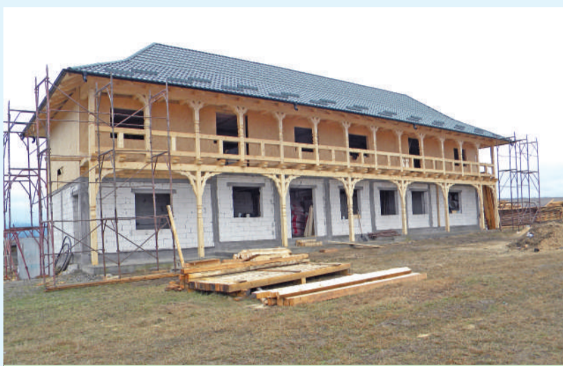
Clădirea căminului de bătrâni, ridicată lângă Biserica „Sfântul Prooroc Ilie Tesviteanu”, din satul Suha, păstrează elemente ale arhitecturii tradiționale proprii satului românesc