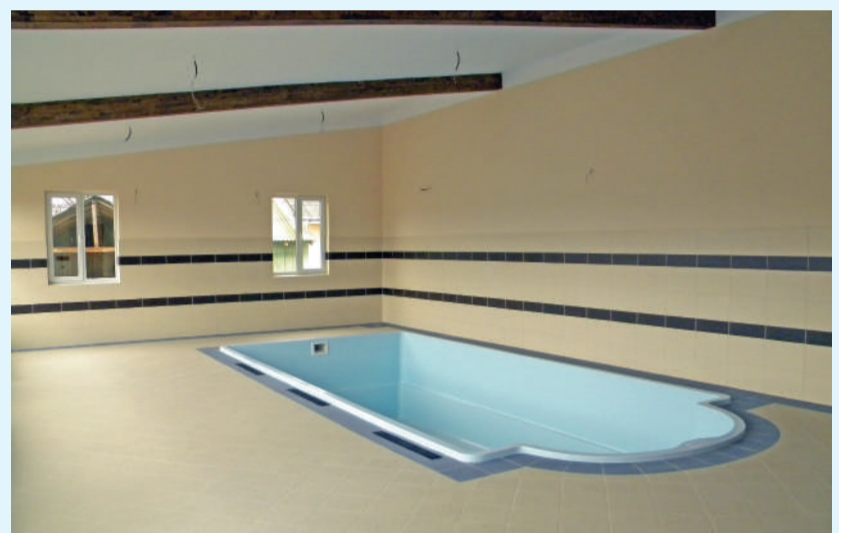
Dincolo de utilitatea lor majoră, spațiile de la anexa pentru tratamente hidroterapeutice se bucură de finisaje moderne, elegante, liniștitoare. În fotografie: salonul cu bazinul pentru apă sărată