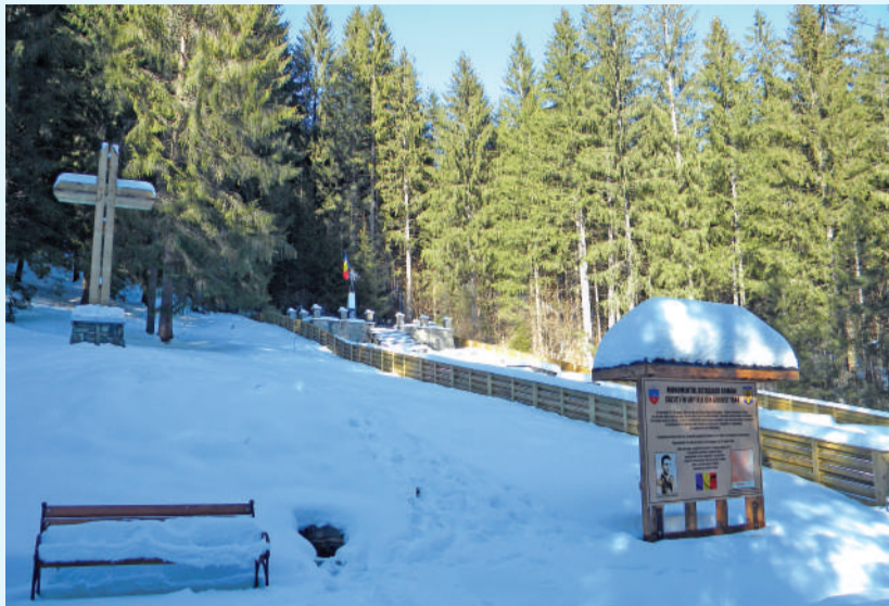
Monumentul Eroilor, văzut dintr-o mirifică perspectivă hibernală

La Mălini, se află într-un stadiu avansat de finalizare, anexa construită lângă sala de sport pentru a găzdui un adevărat complex pentru sănătatea locuitorilor zonei. Bazin cu apă sărată pentru hidroterapie, saună, salon cu pereții din sare, două încăperi cu aparatură pentru gimnastică de întreținere sau de recuperare.