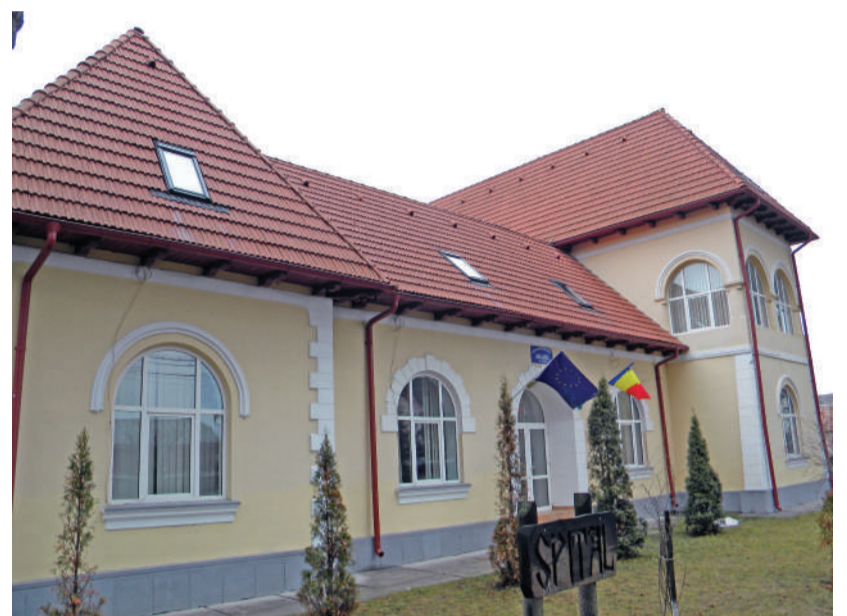
Ridicată din ruină, clădirea în care funcționează Unitatea de Asistență Medico-Socială constituie o adevărată bijuterie arhitecturală

Iată și câteva precizări normative privind funcționarea unor astfel de unități: