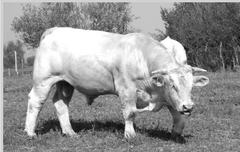
Taurul Galilé - la 20 de luni cântărește 1.000 kg