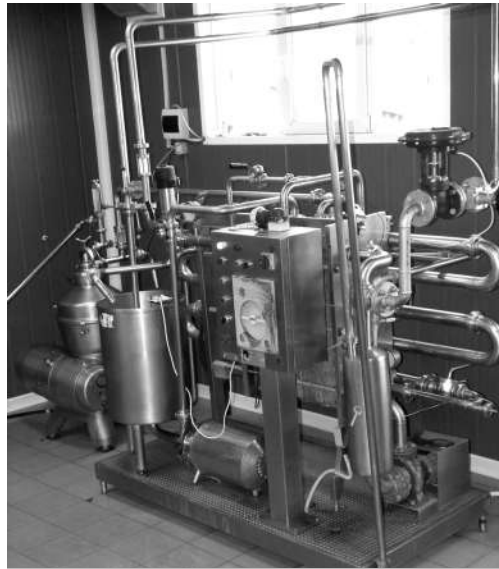
Instalație ultramodernă pe fluxul tehnologic

În finalul procesului tehnologic, firma „Mălinul” obține cașcaval, brânză mozzarella, smântână, brânză de vaci, brânză burduf, caș, telemea. Se bucură de toate aceste produse consumatori din Fălticeni, Suceava, Gura Hu-