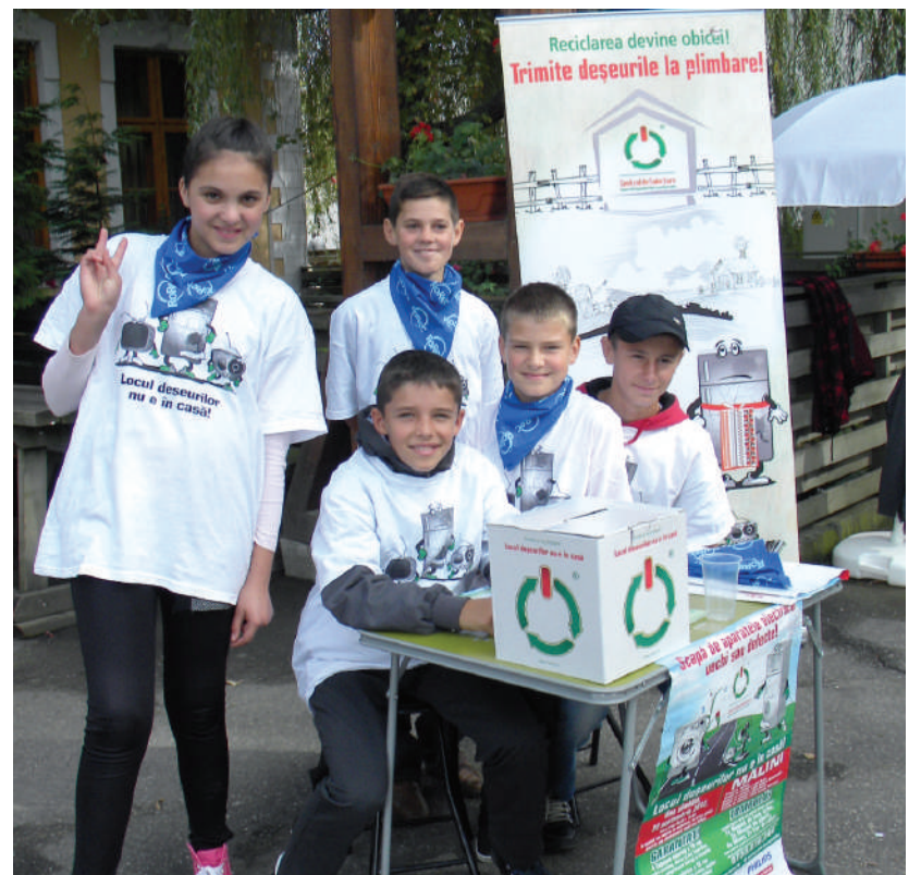
Animatorii și principalii realizatori ai acțiunii au fost elevii de la școlile gimnaziale. În fotografie: echipa de la Mălini