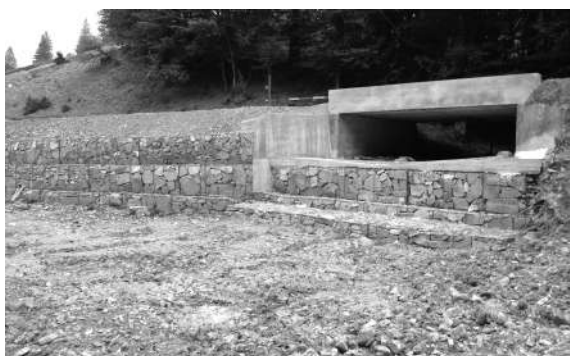
Pod nou construit la intersecția pâraului Pojorâta cu un afluent (torent)