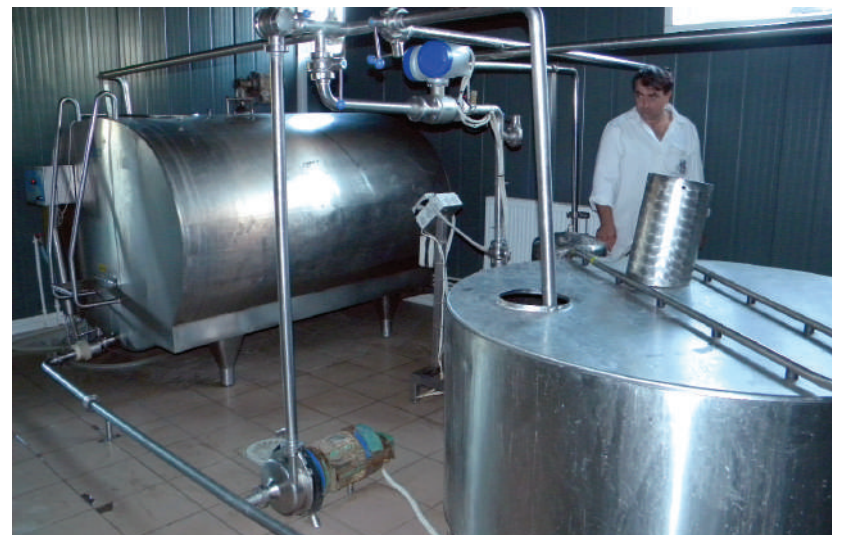
Secția de recepție a laptelui de la firma „Mălinul”

În cele câteva ore cât a durat acțiunea, din satele comunei Mălini s-au strâns peste 2500kg de obiecte vechi sau defecte. Comuna noastră este acum mai ușoară, dar și mai curată, cu peste două tone și jumătate.