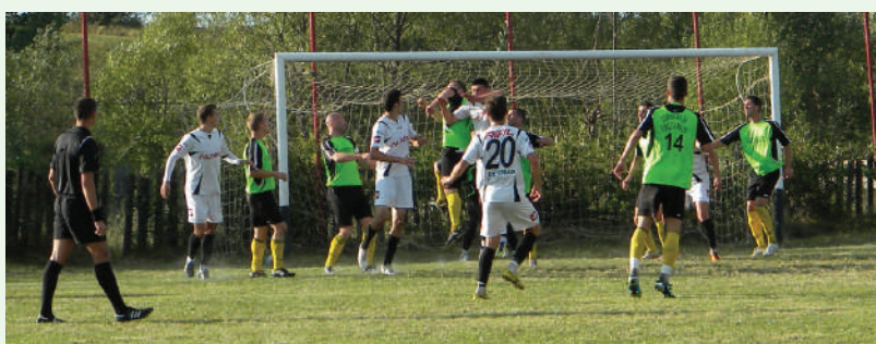
La poarta adversă