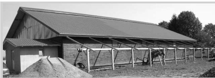
Adăpostul pentru animale de la ferma „Cerbărie”