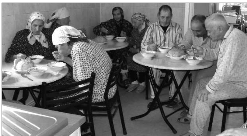
În sala de mese a Unității de Asistență Medico-Socială din Mălini

Se poate spune că în comuna noastră, administrația locală așază la locul convenit grija față de concetățenii de vârstă a treia, acordându-le grija și respectul pe care le binemerită, precum și, într-o măsură apreciabilă, ajutorul de care au nevoie.