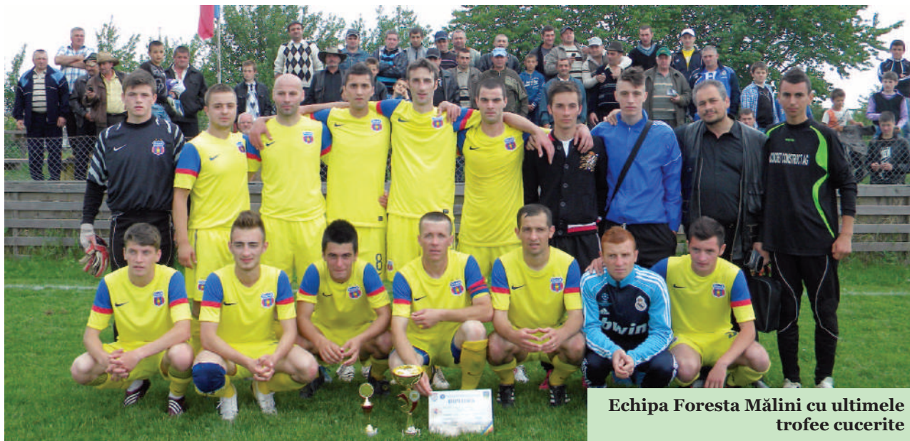
Echipa Foresta Mălini cu ultimele trofee cucerite

În ultimul meci disputat acasă, Foresta a câștigat cu 3-0 în fața formației Flor Construct Pătrăuți și se află în clasament pe un onorant loc trei.