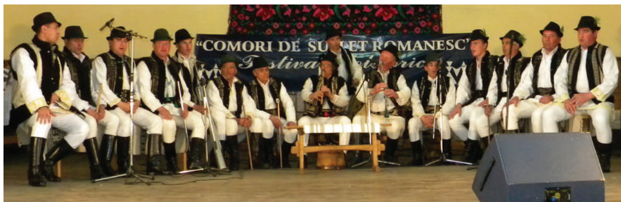
Grupul folcloric „Flori de mălin” în timpul spectacolului