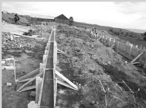
Șantierul saivanului din Smidă

În perioada care a trecut de la înființare, Asociația Agri-