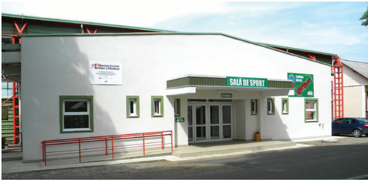
Sala de sport multifuncțională din centrul comunei construită în timp record