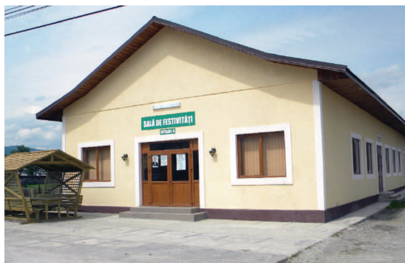
Căminul cultural nou construit în satul Suha

Tot în această perioadă a fost amenajat un parc cu utilități moderne la Pojorâta. La fel s-a realizat parcul de la primărie și s-a dat o față cu totul nouă, civilizată parcului din centrul comunei.