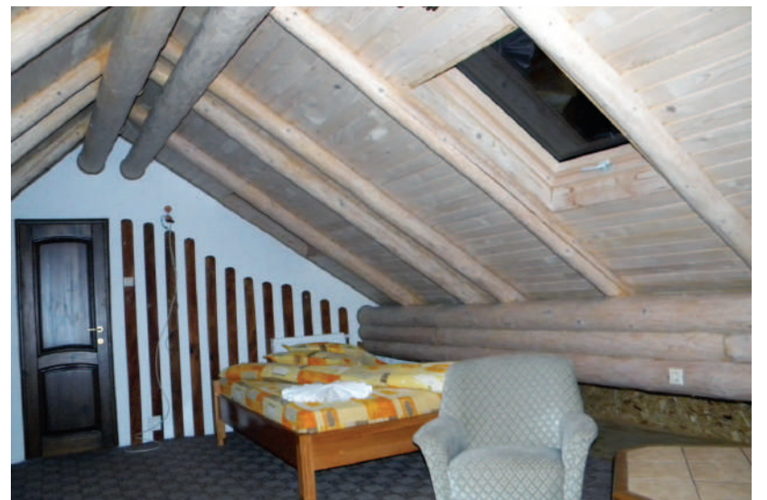
Subtilitatea și eleganța sunt caracteristicile principale ale realizării interioarelor la pensiunea „Poiana Doamnei”