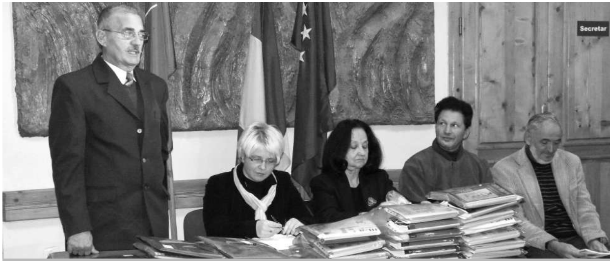
Aspect din timpul festivității de premiere