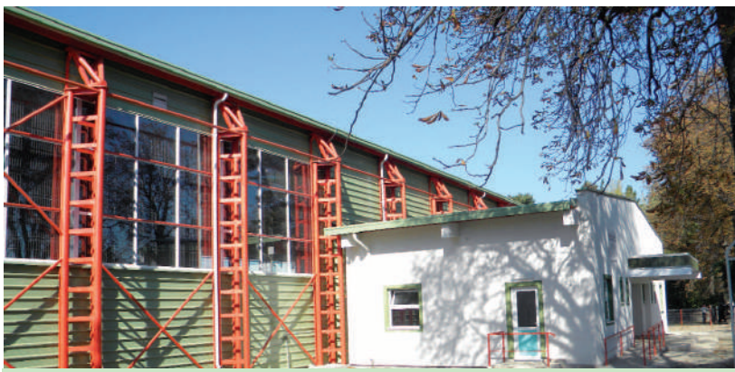
Sala de sport – încă un argument al devenirii europene a comunei Mălini