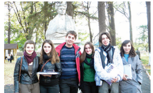
Câțiva din laureații festivalului-concurs de poezie fotografiați la statuia poetului

A doua zi, sâmbătă 15 octombrie 2011, activitățile s-au