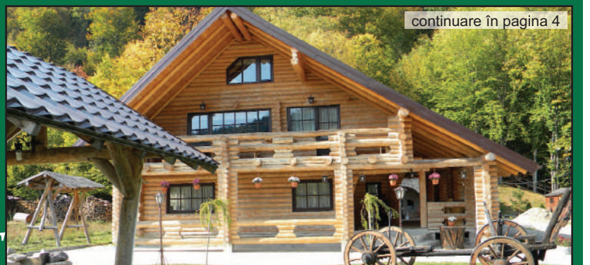
continuare în pagina 4