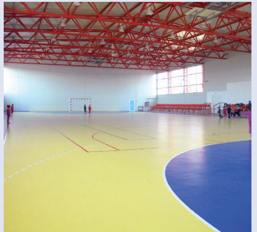
Sala de sport propriu-zisă: spațioasă, luminoasă, multifuncțională - modernă în adevăratul sens al cuvântului

Construcția a fost proiectată de societatea botoșăneană „Nord Proiect”, iar realizarea a aparținut societății „Con – Dacia”, tot din Botoșani.