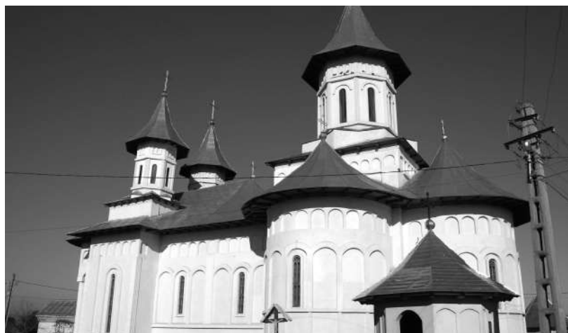
În Pâraie, se ridică biserica ortodoxă care va purta hramul „Nașterea Maicii Domnului”