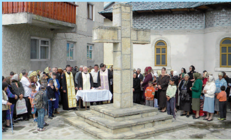
Aspect din timpul slujbei de pomenire a eroilor din comuna Mălini care s-au jertfit pentru libertatea și demnitatea poporului român

Întreaga activitate s-a constituit într-o reușită sărbătoare a Înălțării Domnului și a omagierii concetățenilor noștri care s-au jertfit pentru țară și popor.