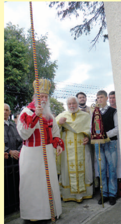
Secvență de la slujba de sfințire a bisericeții cu hramul „Înălțarea Domnului”

Numeroși credincioși au ținut să fie de față la slujba de sfințire a bisericeții – un moment de recuperare spirituală, de apropiere de cele sacre, creștinești, o adevărată sărbătoare a sufletului.