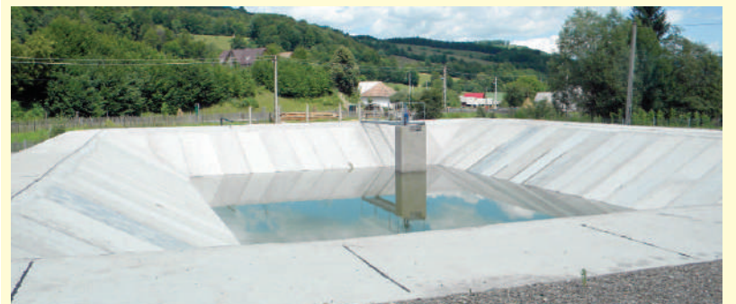
Bazinul pentru acumularea apei cu o capacitate de 4500 metri cubi

Valoarea totală a acestei investiții se ridică la un milion de euro.